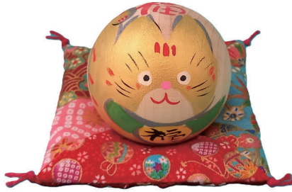
■ 民芸工房たかはし