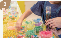
かんたん万華鏡手づくり体験