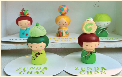
メリーメリークリスマスランド