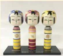
仙台名物こけし・仙台プロスポーツこけしなどを販売