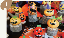
えっくおじさんのエッグクラフト教室