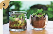
苔テラリウム体験