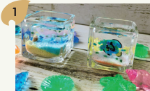
キャンドルづくりなど