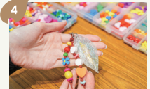
スケルトンキーホルダー作り