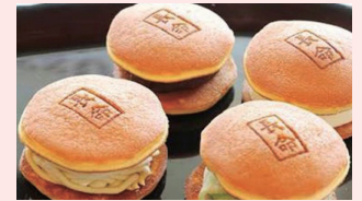
Sweets Shop OZZY