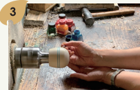
こけし絵付け・ペン立て作り