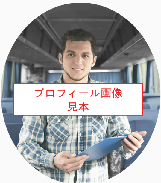
プロフィール画像 見本